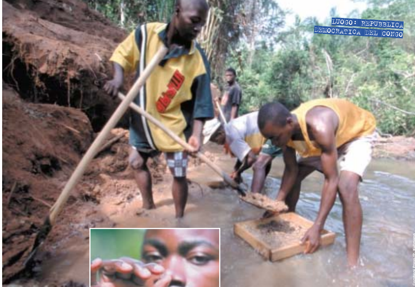
LUOGO: REPUBBLICA DEMOCRATICA DEL CONGO