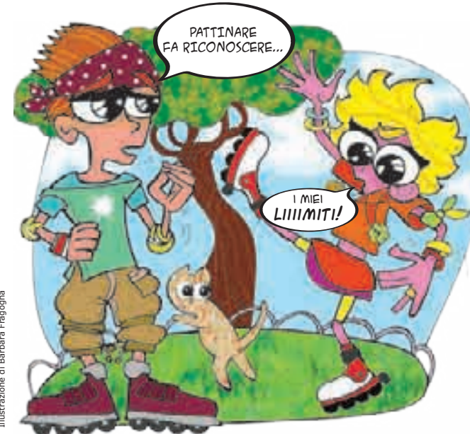
Illustrazione di Barbara Fragogna

Eleonora: Sì, o almeno, così dovrebbe essere. Forse non è sempre facile conciliare queste due parti.