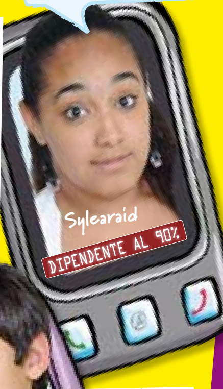
Sylearaid DIPENDENTE AL 90%

☉ Primo cell: usa il vecchio cellulare di suo papà. I genitori glielo hanno regalato per chiamarlo quando esce. ☉ Lo usa: per contattare i genitori e qualche volta per parlare con gli amici. ☉ Ha detto: per il momento mi basta.