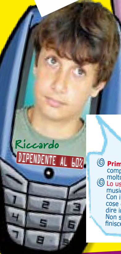
Riccardo DIPENDENTE AL 60%

Si può resistere per una settimana senza il cellulare? Il Messaggero dei Ragazzi ha chiesto a una classe di sottoporsi a questo esperimento. Ecco il diario dei partecipanti a questa sfida impossibile!