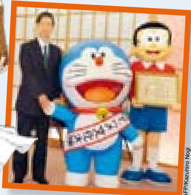
Il gatto-robot Doraemon, per esempio, è così popolare che il governo nipponico l'ha scelto come suo rappresentare all'estero.