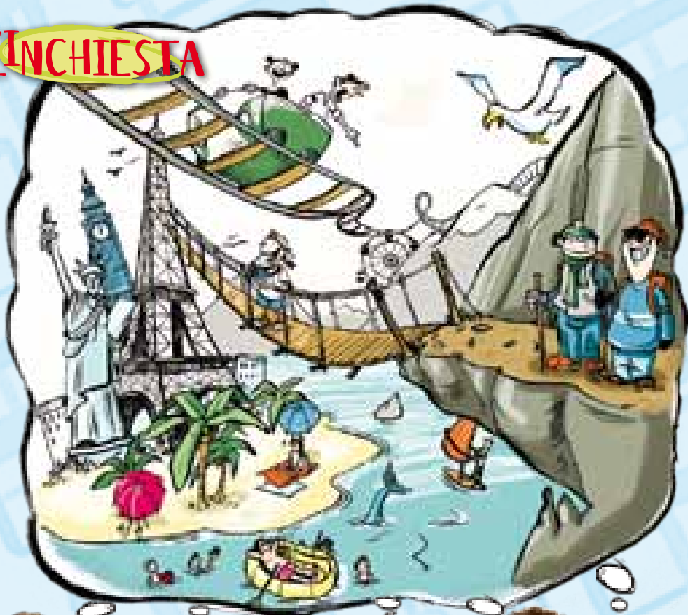
Illustrazione di Margherita Allegri